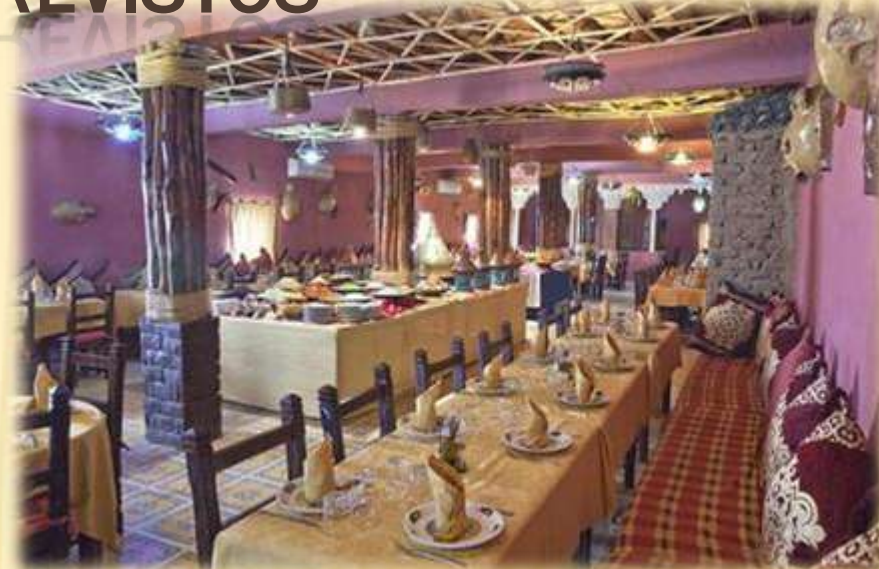
HOTEL KASBAH TOMBOUCTOU