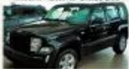
CHEROKEE 2.8 CRD SPORT - 25.500 € 30112010 - 0 KM - GAR. OFICIAL