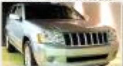
JEEP C.CHEROKEE 3.0 CRD V6 OVERLAND 18012011 - 0 KM - GAR. OFICIAL - 41.500 €