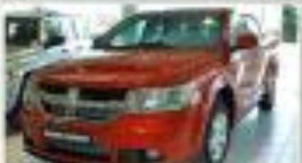
DODGE JOURNEY 2.8 CRD S&T - 25.800 € 18012010 - 13.000 KM - 2 AÑOS GAR.