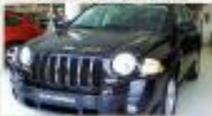
JEEP COMPASS 2.3 CRD SPORT - 34.600 € NUEVO