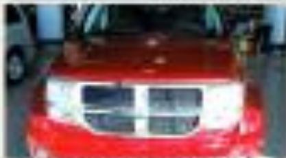
DODGE NITRO 2.8 CRD S&T - 31.500 € 18012011 - 0 KM - GAR. OFICIAL