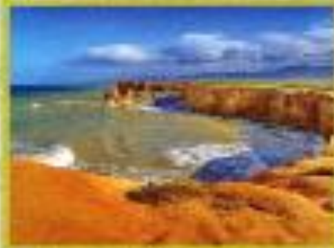
Algunos de los mejores lugares para disfrutar de la playa en la Costa Oriental marroquí son los que permiten que nuestros visitantes puedan disfrutar a la vez de la playa, el mar y la historia de la zona. Hay playas muy bonitas y lugares muy interesantes para visitar.