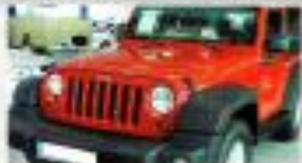
JEEP WRANGLER 2.8 CRD SP - 27.500 € 18012010 - 13.000 KM - 2 AÑOS GAR.