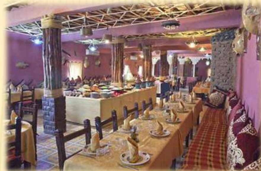
HOTEL KASBAH TOMBOUCTOU